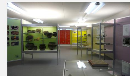
Blick ins Pfahlbaumuseum Lüscherz

Die Zeittafel fixiert einige kulturgeschichtlich wichtige Daten unserer Region im Vergleich mit den Kulturen des Mittelmeerraumes.