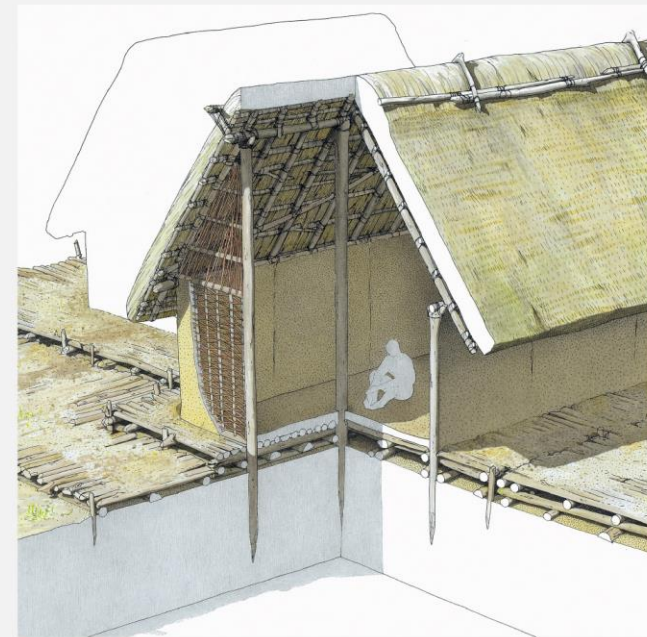
Rekonstruktion eines neolithischen Hauses mit leicht erhöhtem Prügelboden